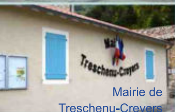
Mairie de Treschenu-Creyers