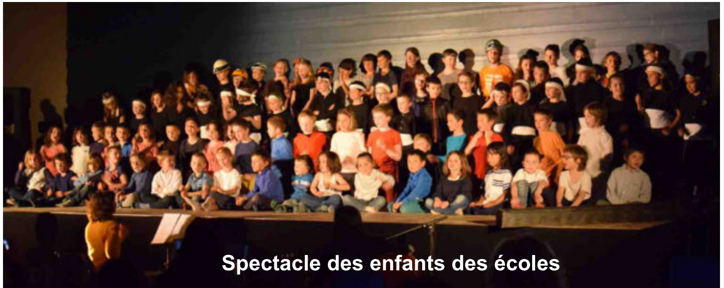
Spectacle des enfants des écoles

Visites au foyer logement St Jean et à la crèche.