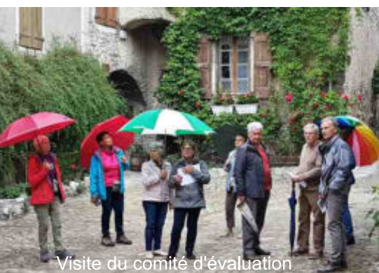
Visite du comité d'évaluation