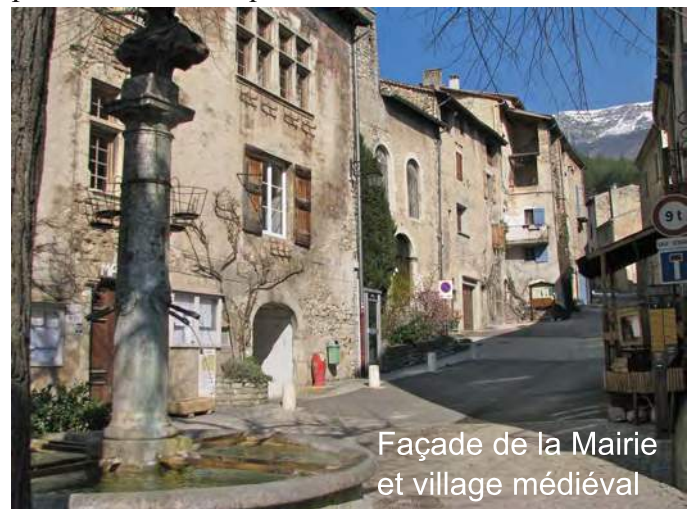
Façade de la Mairie et village médiéval