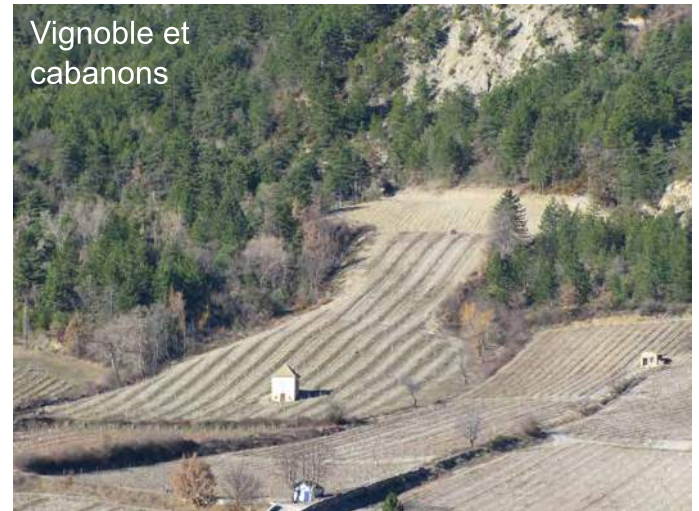
Vignoble et cabanons

un circuit allant des cabanons aux vignobles (période des vendanges en septembre) qui se terminera par la visite d'une cave. A noter que les cabanons figurent comme patrimoine remarquable dans le nouveau guide du Patrimoine de la Drôme, édité cette année par le Conseil Général.