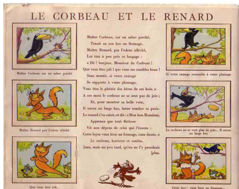
Album d'images du chocolat Menier