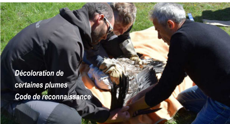
Décoloration de certaines plumes Code de reconnaissance

Le parc du Vercors a installé une webcam pour