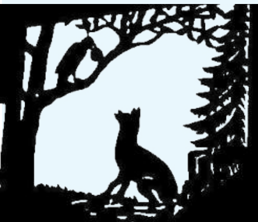
Le corbeau et le renard

Comme vous le savez peut-être, Jean de la Fontaine aura bientôt 400 ans !