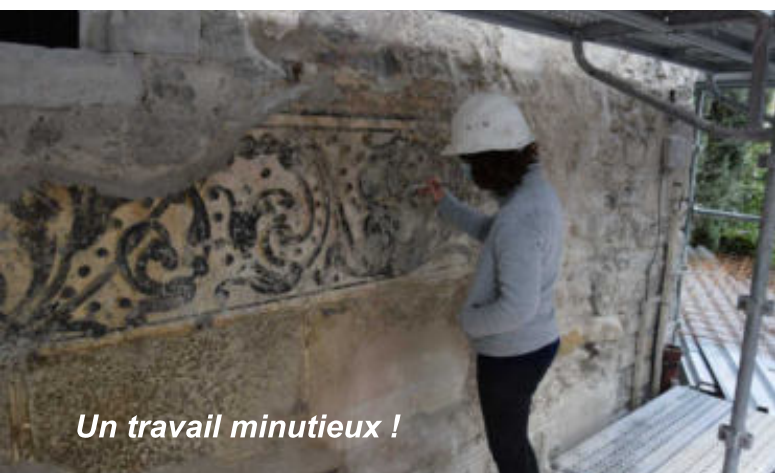
Un travail minutieux !

Pour la façade de la mairie sur la Place du Reviron, les choses sérieuses commencent avec la restauration des décors. Lorsque le dessin existe ou lorsque les éléments de dessin sont encore suffisamment visibles, le décor sera restauré pour retrouver son aspect d'origine. Dans les parties lacunaires du décor, le dessin sera restitué en légère demi-teinte pour distinguer les parties originales de celles reconstituées.