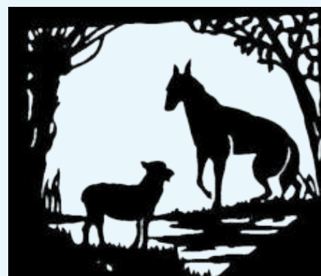
Le loup et l'agneau