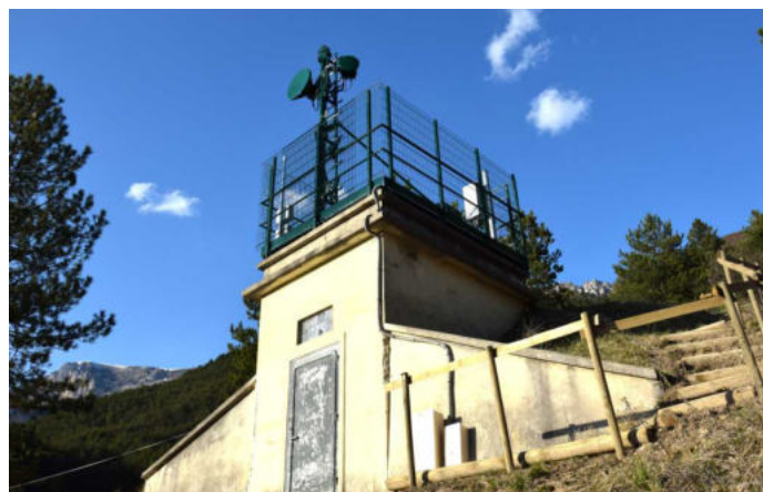
Montagne de Piémard 1059 m

Au fait avez-vous vu les antennes sur le réservoir d'eau ? Peu visibles car munies d'un capot vert, elles servent à relayer par faisceau hertzien les signaux de la grande antenne vers l'antenne d'Aucelon-Pas de Jansac.