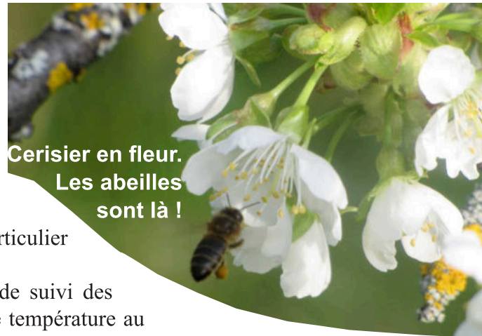
Cerisier en fleur. Les abeilles sont là !