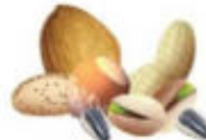
Fruits à coques broyés