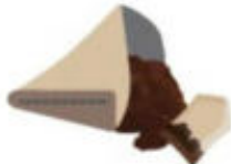
Marc de café, filtres, sachets de thé