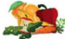
Fruits et légumes abîmés et épluchures