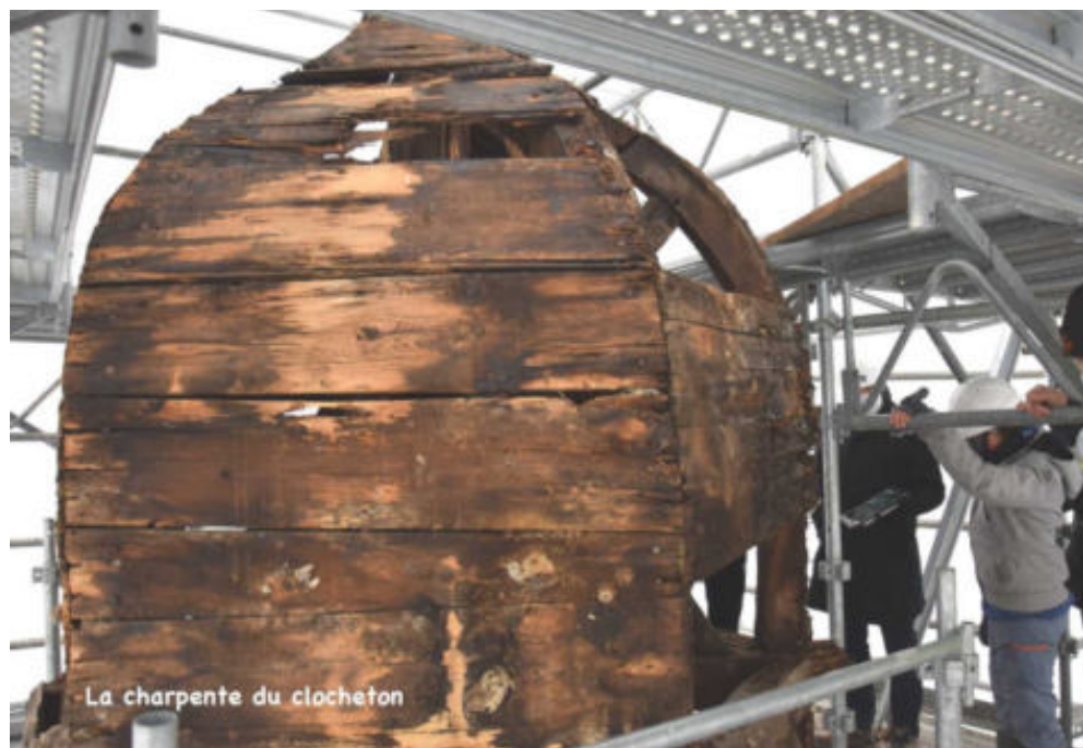
La charpente du clocheton