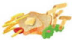
Restes de repas d'origine végétale