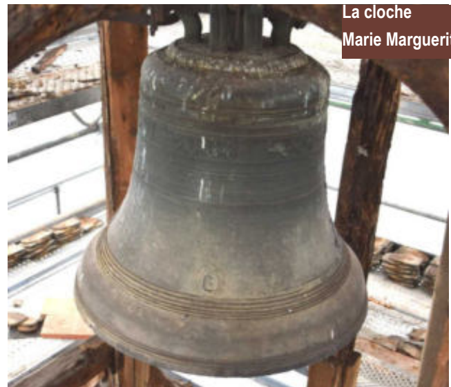
La cloche Marie Marguerite

À l'étage au-dessus on accède à la cloche et l'on peut voir que la charpente en chêne est partiellement en très mauvais état. Quant à la couverture du clocheton en fer blanc bien brillant à l'origine elle est rouillée. Le voligeage sous-jacent est complètement pourri. Le fer blanc sera remplacé par du cuivre étamé pour allier durabilité et brillance.