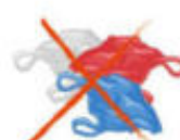
Sacs plastiques même bio-dégradables