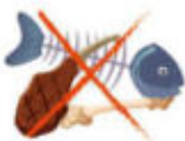
Restes de viandes et de poisson

Mettre en petits bouts les apports facilite le compostage !