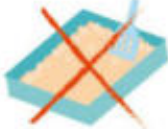
Litières d'animaux et excréments