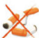
Filtres de cigarettes