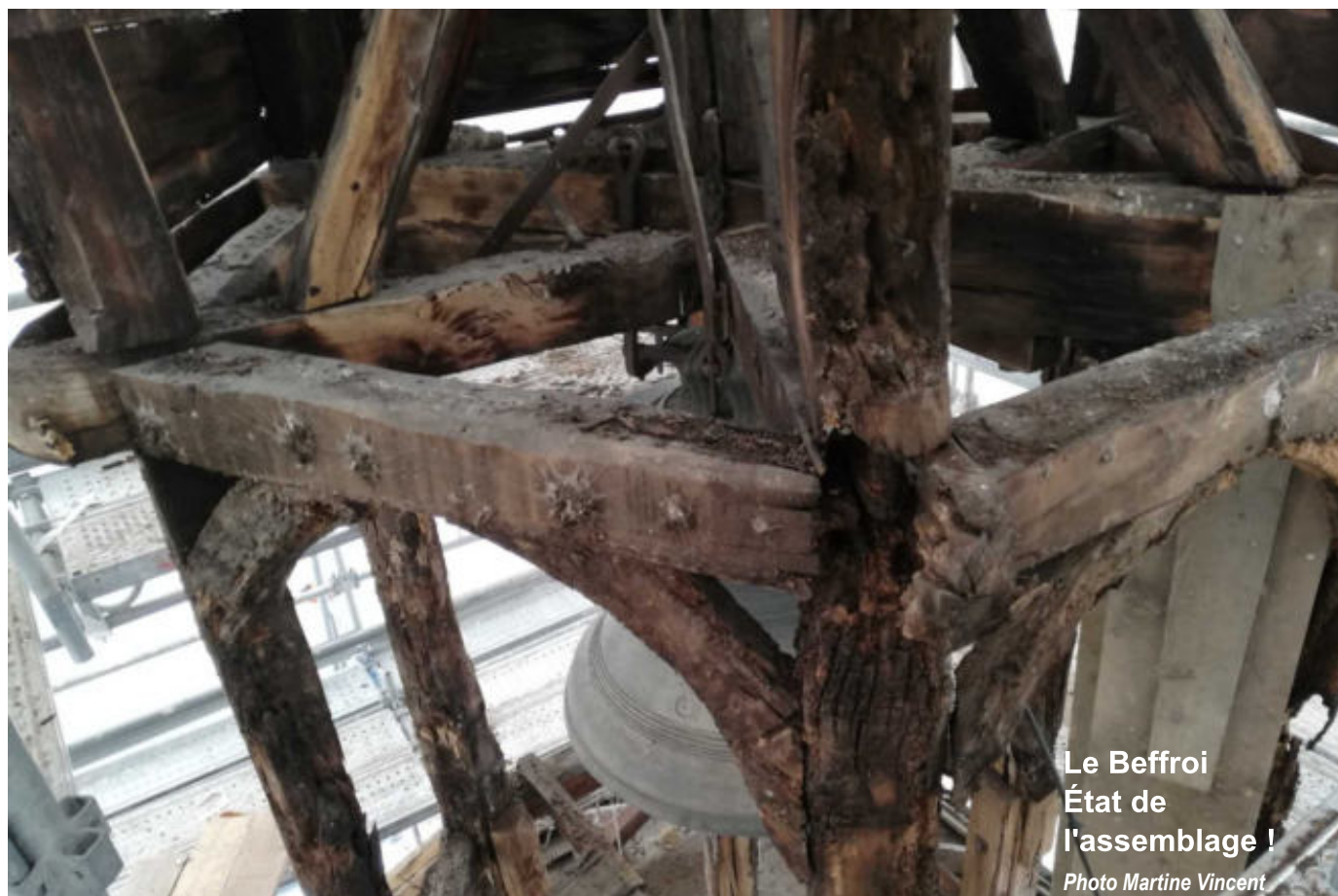
Le Beffroi État de l'assemblage !