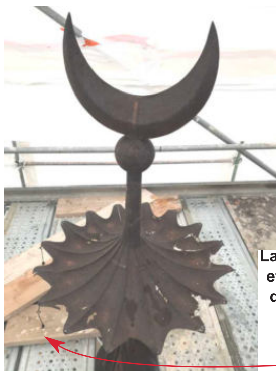
La lune, le soleil et les planètes qui pendaient au bout de petites chaînettes

Il faudra aussi remettre en état la girouette et l'évocation du système solaire : une couronne solaire supporte sur ses pointes des chaînettes auxquelles pendaient des planètes. Nous sommes à la recherche de photos où l'on verrait ces planètes ! Et tout en haut le croissant de lune qui tend ses pointes vers le ciel !