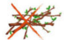
Branches, tontes, feuilles

Qu'est-ce que je ne dois pas mettre dedans ?