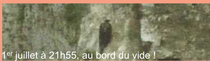
1 er juillet à 21h55, au bord du vide !