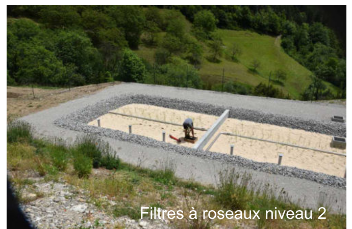
Filtres à roseaux niveau 2