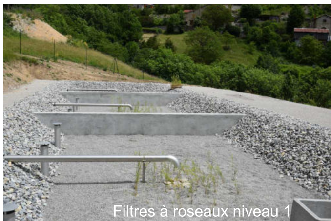
Filtres à roseaux niveau 1