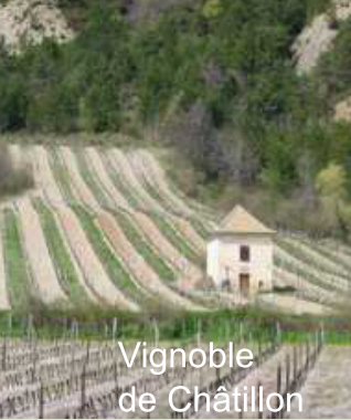
Vignoble de Châtillon