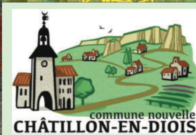
commune nouvelle CHÂTILLON-EN-DIOIS