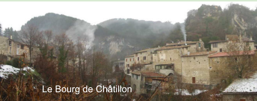
Le Bourg de Châtillon