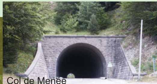
Col de Menée