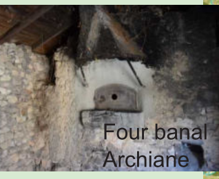
Four banal Archiane