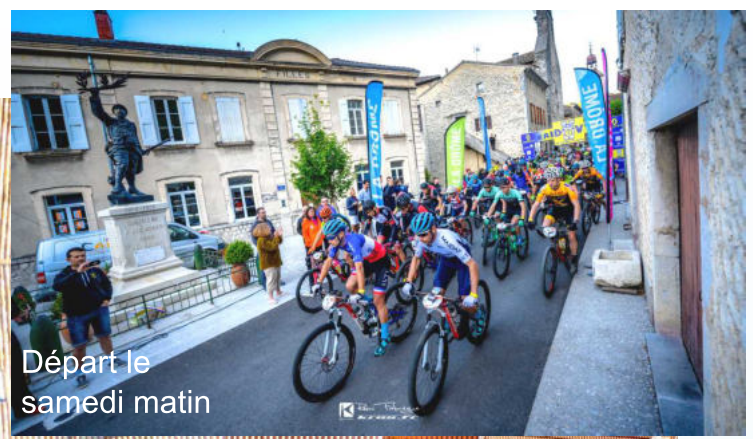
Départ le samedi matin