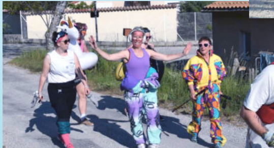
La ronde des cabanons