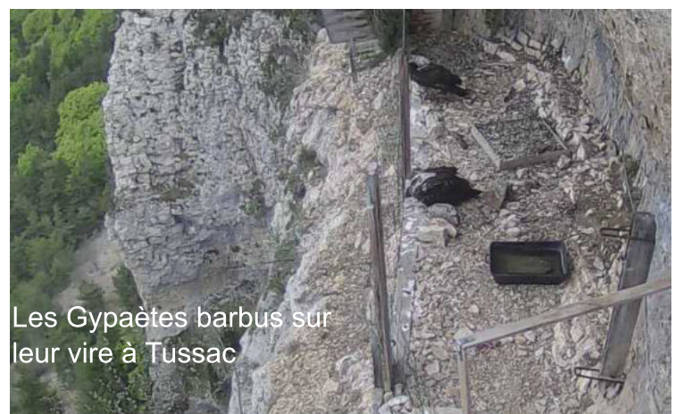
Les Gypaètes barbus sur leur vire à Tussac

les dangers et de s'intégrer dans notre vaste monde.