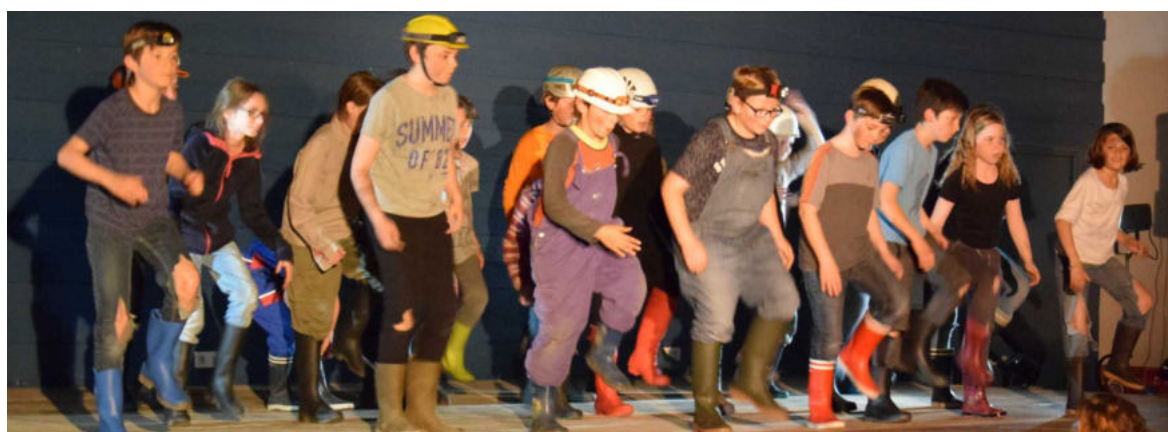
Spectacle des écoles Avril 2019