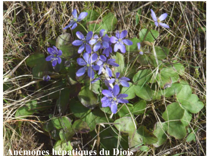
Anémones hépatiques du Diois