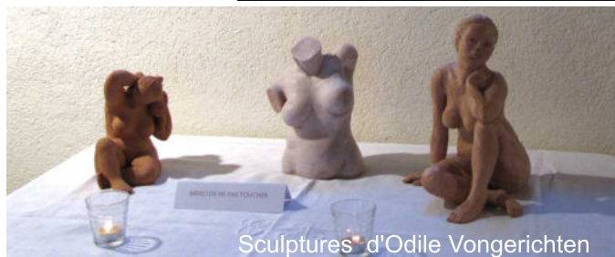
Sculptures d'Odile Vongerichten