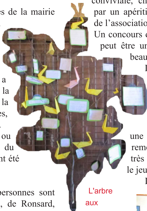
L'arbre aux poèmes des enfants de l'école